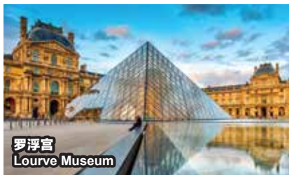
罗浮宫 Louvre Museum