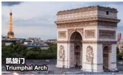
凯旋门 Triumphal Arch