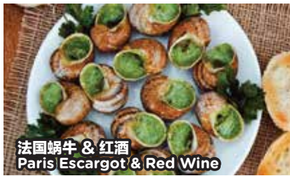
法国蜗牛 & 红酒 Paris Escargot & Red Wine